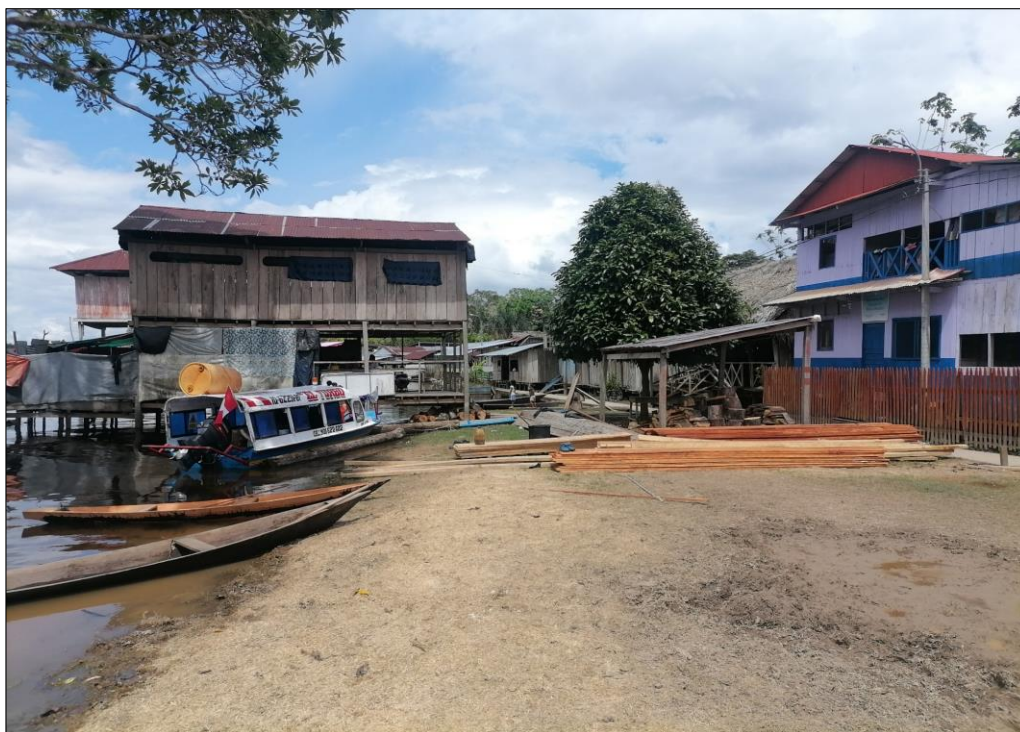
FIGURA N°02: ALGUNAS VIVIENDAS DE LA COMUNIDAD NATIVA NUEVO SAN JUAN SE ENCUENTRAN EXPUESTOS ANTE EL INCREMENTO DEL NIVEL DE AGUA DEL RÍO.