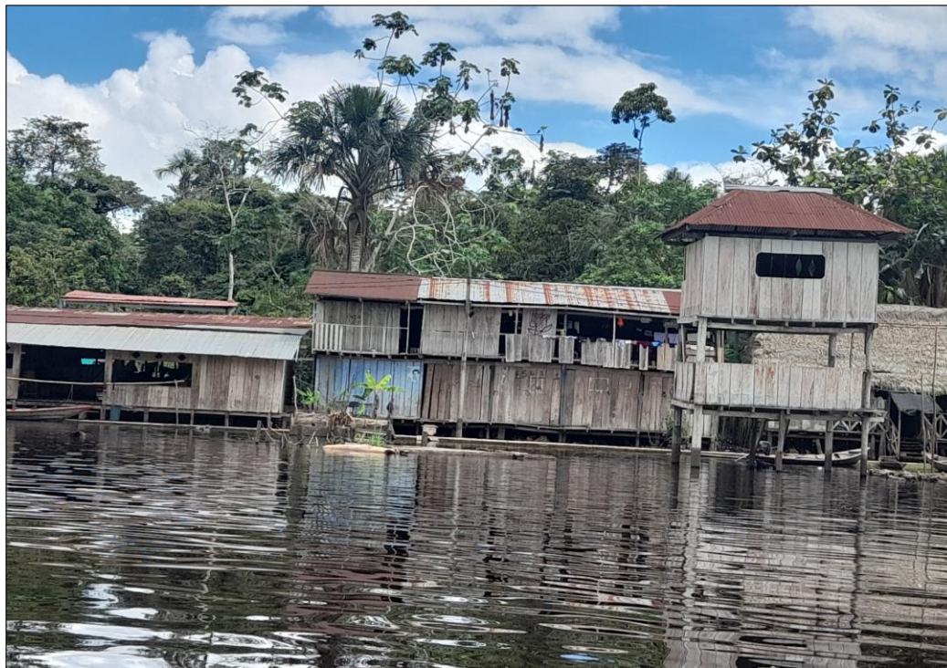
FIGURA N°01: TRAMO CRÍTICO EN EL RÍO CHAMBIRA EN EL SECTOR COMUNIDAD NATIVA NUEVO SAN JUAN, DISTRITO URARINAS, PROVINCIA DE LORETO, DEPARTAMENTO DE LORETO.