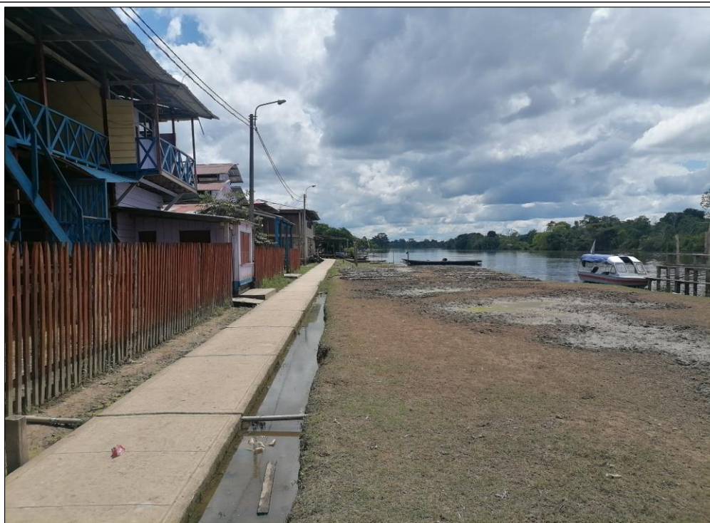
FIGURA N°03: EN EL TRAMO DE INTERVENCIÓN, LA RIBERA DE LA MARGEN IZQUIERDA DEL RÍO CHAMBIRA, LA RIBERA SE ENCUENTRA MUY DEBILITADO, ESTO A CONSECUENCIA DE LAS VELOCIDADES EROSIVAS DE LA CORRIENTE.